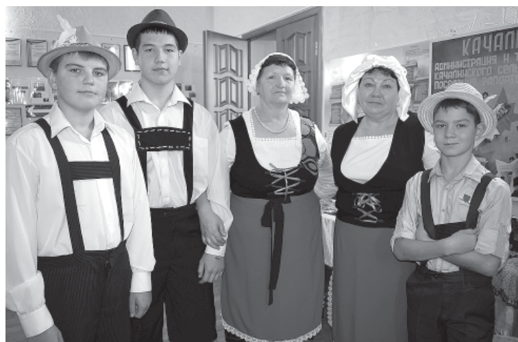
Впервые на фестивале представляли свою культуру немцы Поволжья