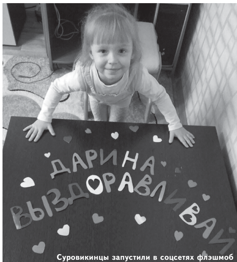
Суровикинцы запустили в соцсетях флэшмо