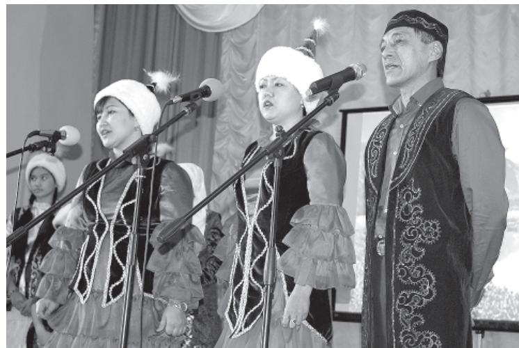
Выступает творческий коллектив «Наурыз»

Если вы придёте в гости к казахской семье, причём неожиданно, то будете приняты так, как будто вас ждали тут целую