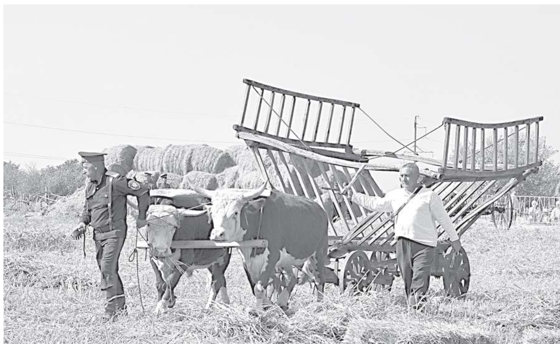
Пара быков в наше время — экзотика