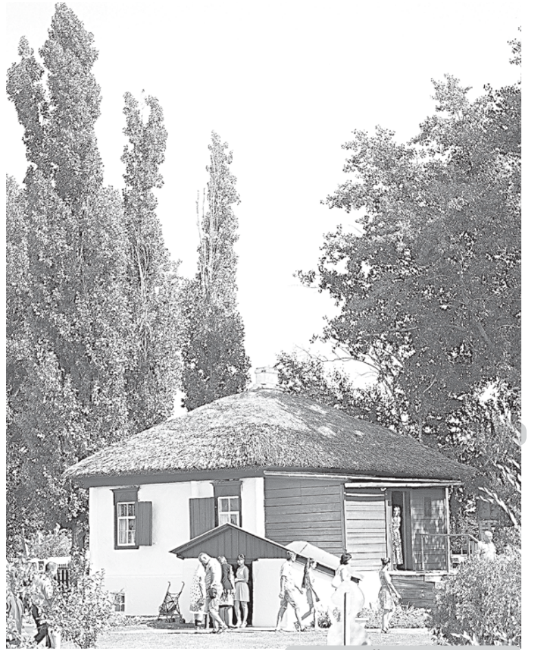
Дом-музей М.А. Шолохова

Выйдя из куреня, наша делегация прошла по подворью с амбаром, колодцем, редкой для казаков добротной баней. Посетили мы и торговую лавку, что держал отец писателя. Любопы-