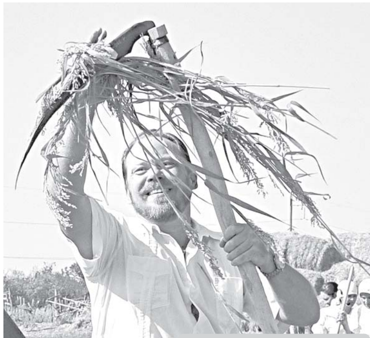
Внук писателя закончил покос