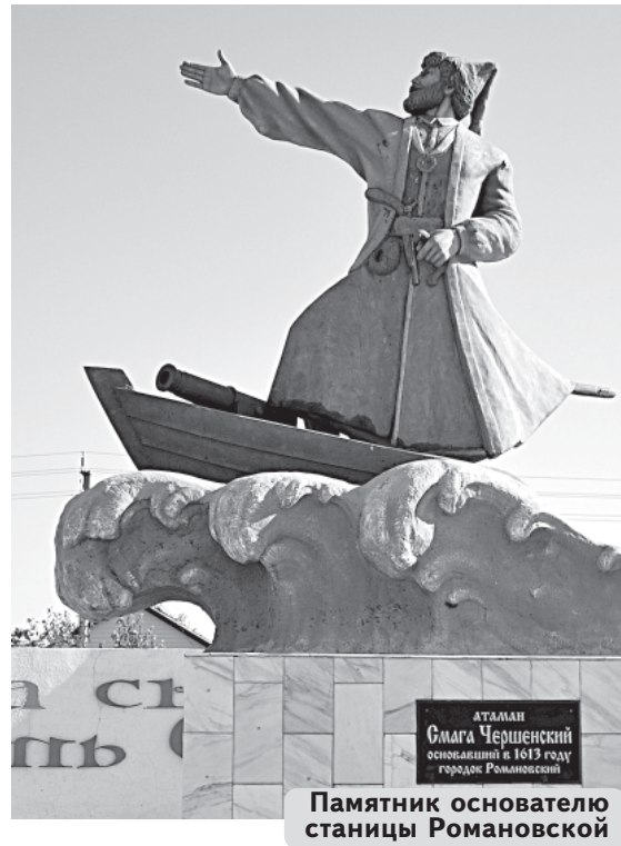
Памятник основателю станции Романовской

В работах было задействовано 8 000 машин и механизмов: скреперы, бульдозеры, самосвалы, землеройные снаряды. Специально под строительство был разработан шагающий экскаватор со стрелой в 65 метров. Сооружали канал сначала немецкие военнопленные, причём только с выс-