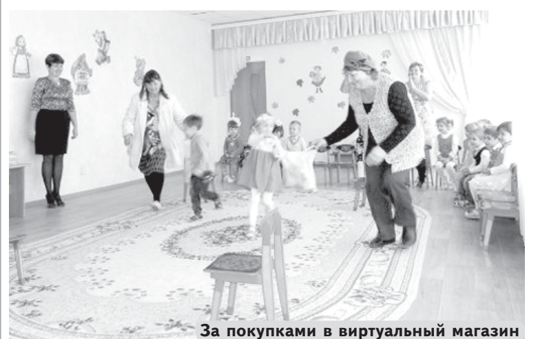
За покупками в виртуальный магазин