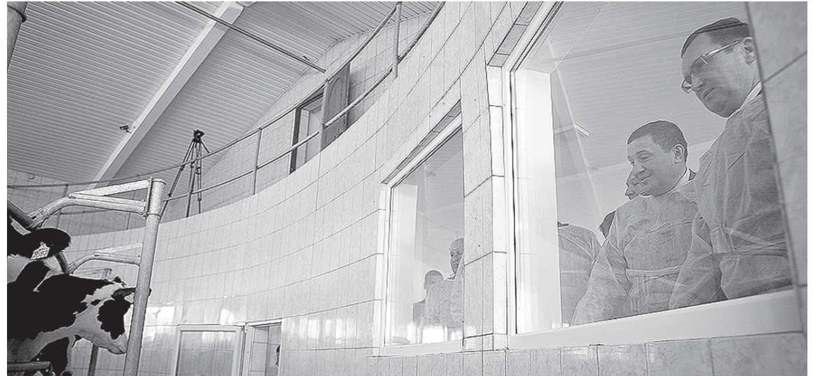
Строительство новых производственных комплексов - одна из важных составляющих развития сельскохозяйственной отрасли

открывать новые животноводческие фермы, должны быть созданы достойные социальные условия для села, - считает Андрей Бочаров.