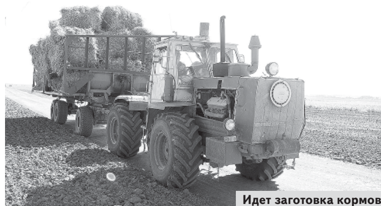
Идет заготовка кормов