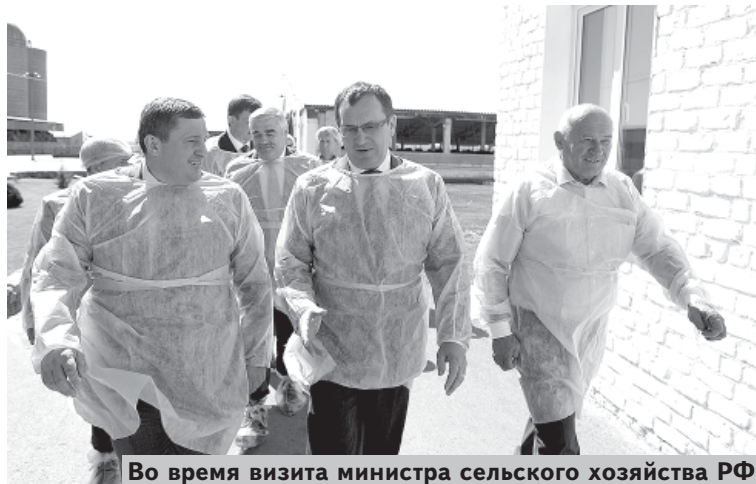
Во время визита министра сельского хозяйства РФ

Андрей Бочаров договорился с главой Минсельхоза РФ Николаем Федоровым о дополнительной федеральной помощи для волгоградского АПК