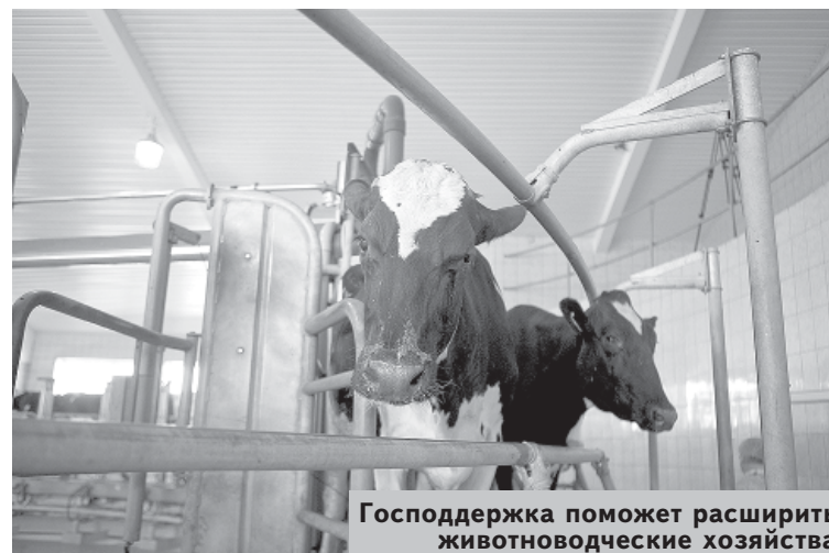
Господдержка поможет расширить животноводческие хозяйства

— Без мелиорации в условиях волгоградского климата невозможно развивать крупные животноводческие фермы. Это направление мы уже определили приоритетом и будем наращивать финансирование, — отметил Андрей Бочаров.