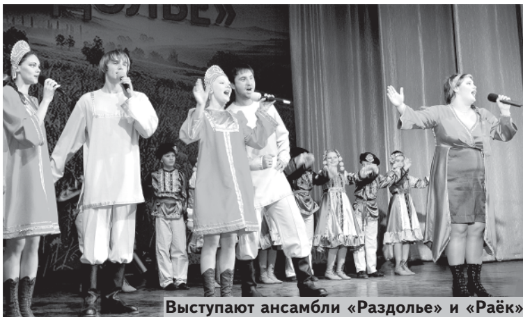
Выступают ансамбли «Раздолье» и «Раёк»