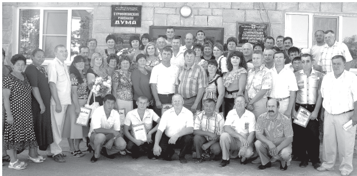
Уважаемые коллеги, сотрудники ветеринарной службы Суровикинского района и ветераны! Примите искренние поздравления в связи с празднованием Дня ветеринарного работника!

Большой и плодотворный путь пройден ветеринарными специалистами. Сегодня специалист ветеринар есть на каждом сельскохозяйственном производстве, на каждом перерабатывающем предприятии, и успехи в проведении ветеринарных мероприятий, прежде всего, зависят от грамотности и работоспособности сотрудников этой службы. Упорство профессионалов и добросовестное отношение к делу достойны большого уважения.