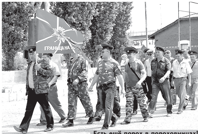
Есть ещё порох в пороховницах!

После Великой Отечественной войны пограничникам пришлось участвовать в боевых действиях в Афганистане. За всё время пребывания в сопредельном государстве в составе ограниченного контингента советских войск среди пограничников не было ни одного случая дезертирства или предательства, никто не попал в плен, не было ни одного ра-