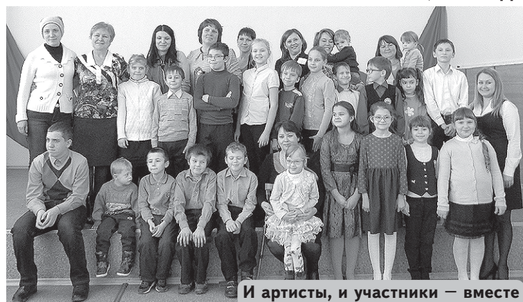
И артисты, и участники – вместе