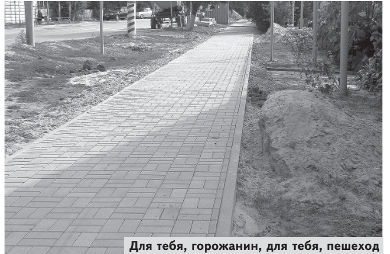
Для тебя, горожанин, для тебя, пешеход

А как же бегущий сплошным потоком транспорт, скажете вы? И особенно лихачи, заставляющие вздрагивать и прижиматься к заборам. Чтобы обезопасить пешеходов, да и самих водителей, городская администрация, получившая из области 10 миллионов рублей на благоустроительные работы, решила пустить их на благие цели. Четыре городских улицы: им. Ленина (от улицы Кирова до Водопроводной), Советская (от старого автовокзала до Луговой), Первомайская и Исполкомовская подлежат реконструкции в связи со строительством пешеходных дорожек. Последние три будут предназначены только для одностороннего движения. Вот так нарядно и просторно будут выглядеть дорожки для пешеходов. А автомобильное движение станет гораздо упорядоченнее и безопаснее для горожан.