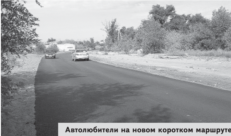
Автолюбители на новом коротком маршруте

Она появилась всего за две недели до юбилея города. Проезд по улице Водопроводной под мостом, минуя железнодорожный переезд, - реализованная давняя мечта горожан и самого мэра. Поэтапные строительные работы после длительных согласований: демонтаж железнодорожных путей, планировка и щебенение самой дороги и, наконец, асфальтирование продолжались довольно длительное время. Зато теперь из центра города попасть в первый микрорайон — дело нескольких минут. И потому этот отрезок пути — самый востребованный суровикинскими водителями легкового автотранспорта. В завершённом виде он выглядит действительно дорогим подарком. А начавшиеся работы по освещению новой дороги только сделают его еще ценнее и дороже для сердец суровикинцев.