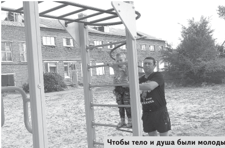
Чтобы тело и душа были молоды

Эта детская площадка появилась тоже в последние предъюбилейные дни среди недостроя прошлых лет в первом микрорайоне, захламленного до предела и удручающего жителей своим неприглядным видом. Свалку убрали, площадку расчистили и поставили на ней детские спортивно-оздоровительные снаряды. На радость взрослых и детей, которые не просто прогуливаются здесь, но и укрепляют здоровье, тренируют тело и заводят крепкую дружбу с физкультурой и спортом. А в жизни это всегда пригодится.