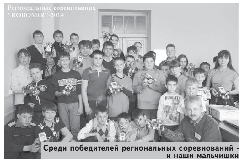
Среди победителей региональных соревнований – и наши мальчишки

В начале кружковой деятельности дети сами по алгоритму собирали роботов из деталей конструктора, подключали к компьютеру и программировали для последующего выполнения