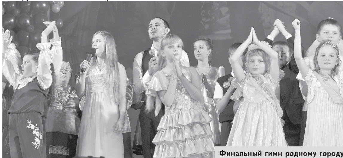
Финальный гимн родному городу

Сцена под стихотворные строчки местных авторов о любимом Суворовкино заполняется всеми, кто славил на празднике родному городу общую прекрасную песню, пробирающая до самых глубин души, прославляющая все поколения суворовкинцев, делавших историю, и будущим, у которых счастливая судьба в городе, лучшем на свете! Зал поднимается навстречу песне и единому порыву радости и гордости за свой богатый на людей и их славные дела край. С днем рождения, Суворовкино! С праздником, суворовкинцы!