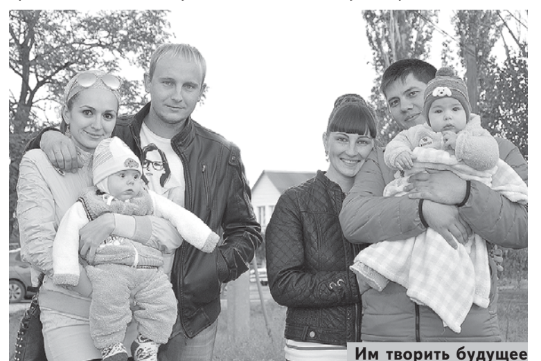
Им творить будущее

Отзвучали завершающие аккорды, последние слова, погасли прожектора, замолчали микрофоны, но горожане ещё долго не расходились с Аллеи Детства. Гуляли, дышали свежим воздухом, обменивались впечатлениями. Погода и полученные эмоции способствовали праздничному настроению.