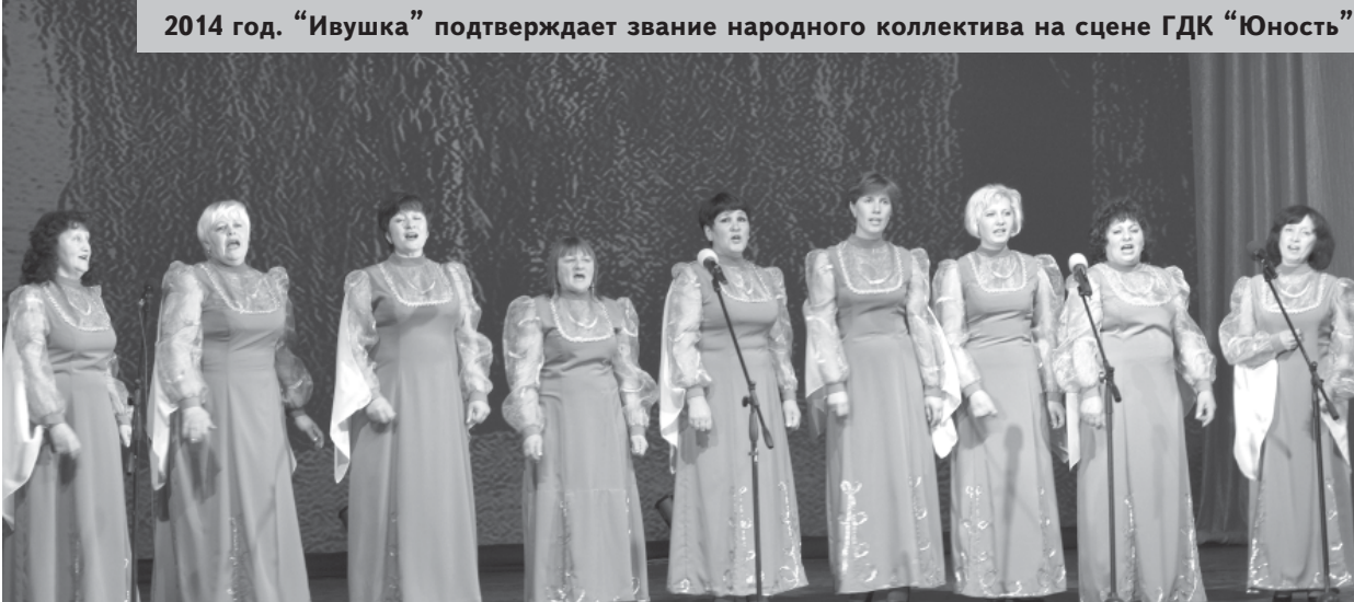
2014 год. «Ивушка» подтверждает звание народного коллектива на сцене ГДК «Юность»

Основной состав много лет не менялся, но возраст брал свое. И название коллектива уже как-то не соответствовало действительности. На очередном совете переименовали ансамбль из «Девчат» в «Ивушку». Пели в основном песни Григория Пономаренко, поэтому название родилось легко, а песня «Ивушка» стала визитной карточкой верхнесолоновцев.